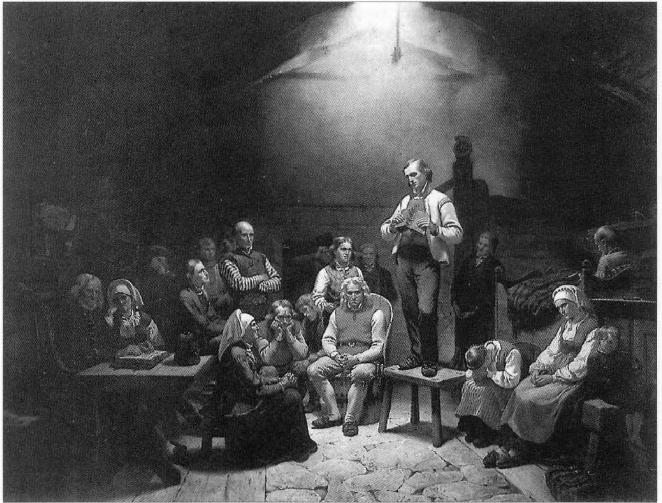
«Haugianerne» malt av Adolph Tidemand (1814–1876) i 1848. Nasjonalgalleriet.