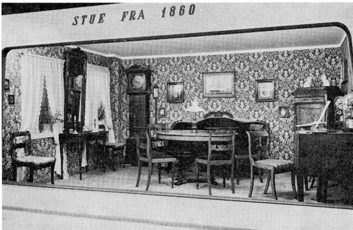
Byinteriør fra 1860 på jubileumsutstillingen i 1954.

lenge å søke disse bygningene gjenreist på et sentralt museumsområde. Lotheparken ble framhevet som en mulighet i denne forbindelsen. Etter en gateregulering ble parken imidlertid for liten til museumsformål. Haraldsvang holdt man lenge på som en heldigere løsning, men også interessen for å nytte dette området svant etterhvert. I dag synes det ikke aktuelt å samle bygningene museet eier rundt om i distriktet. Hver på sitt sted har bygningene noe spesielt å si om fortidens skikk og bruk og tjener på denne måten til å berike lokalmiljøet. Dermed fungerer de allerede tilfredsstillende.