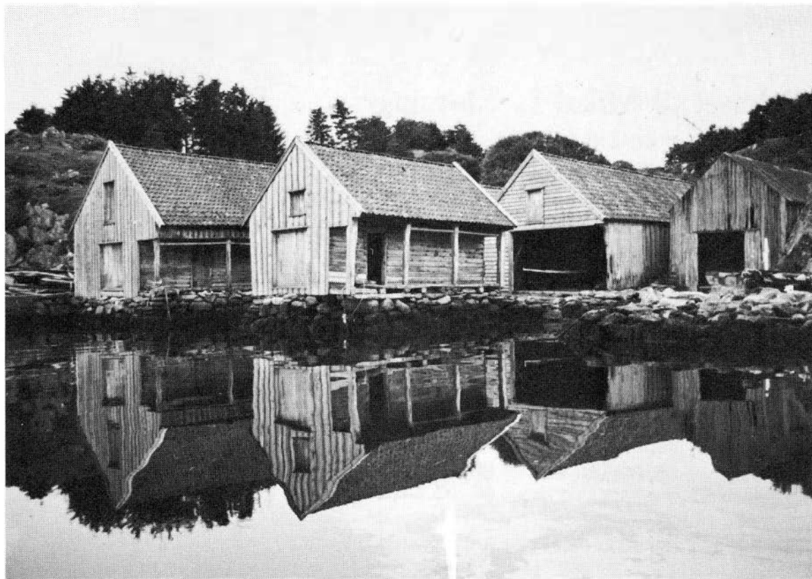
De fem bygningene i Solhåla ligger i to rekker — yngre sjøhus foran og tre eldre naust bak. Mellom husene er støer med båttopptrekk, bakenfor jerrevei og hagemurer. Tak og kledning er for det meste fornyet og vesentlige deler av konstruksjonene skiftet ut siden restaureringsarbeidet tok til i 1980.

Bygningene er delvis åpne. Det er oppslått fører i anlegget.