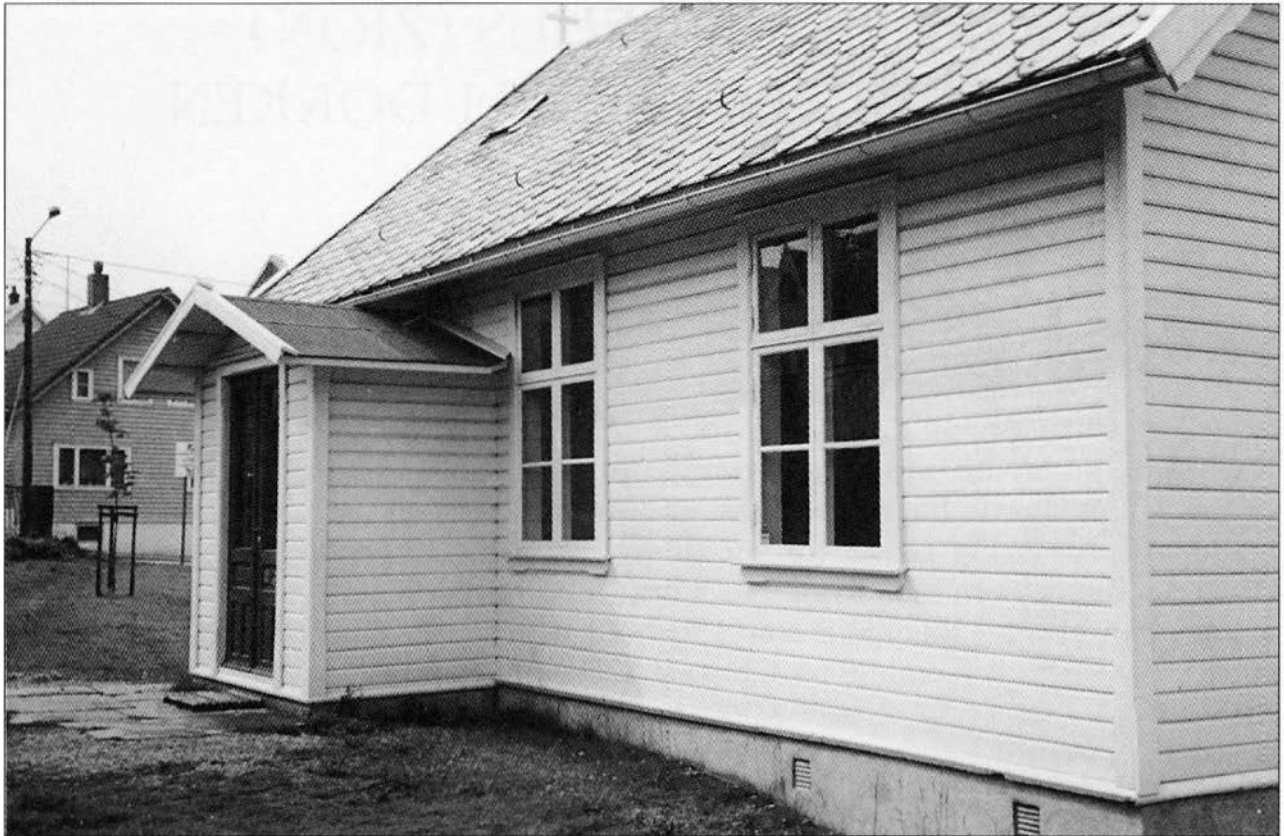
Inngangen er sydvendt. Tidligere vendte den mot øst. Bislaget er rekonstruert etter spor og bevarte bygningsdeler. Men taket er gjort litt flatere for å unngå å bryte hovedgesimsen.

museet interiøret pusse opp allerede mens huset sto på Norheim. Etter flyttingen er det flikket. Både kulørene i interiøret og bruken av laserteknikker er karakteristiske for smaken i Karmsund-regionen på 50-tallet.