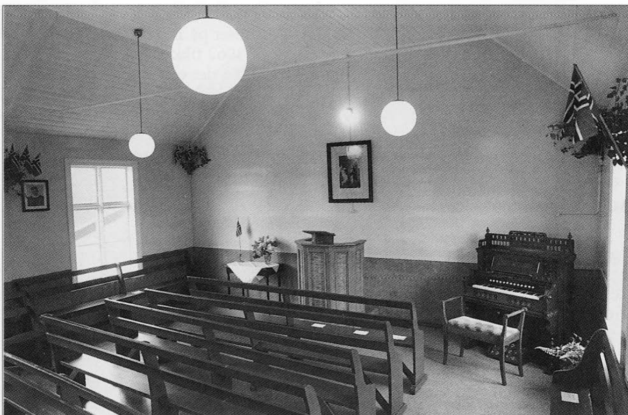
Salen på Zion står med farger og utstyr fra 1950. Benkene er fra ungdomshuset på Bokn. Bak salen er det kammers for mindre møter. Over kammerset er det kjøkken. Det blir moderne kjøkken og toilett for Dokken i kjelleren.