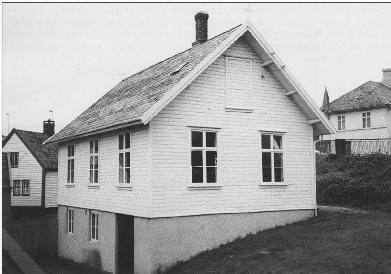
Zion på ny tomt mellom museumshusene i Dokken. Beliggenheten er som før i skrånende terreng. Men kjelleren i huset var tidligere lavere. Zion bærer budskap både om bedehuskulturen og om sveitserstilens former og konstruksjoner.