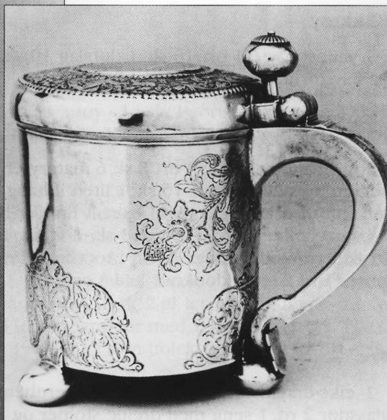
Norsk sølvkanne med bergensk sølvmedstempel 1782. Skjæring med jerngryte.

epleskivepanne med 5 rum 3 ort 8 sk, 1 kaffekanne med 3 føtter 2 ort, 1 mindre Do 1 ort, 2 små kopperpanner 1 ort 12 sk.