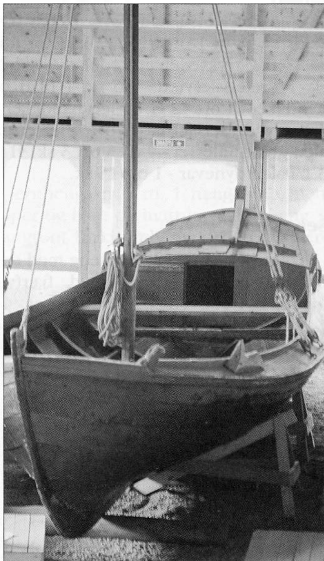
Vengbåt fra Baustad, Nedstrand. MHB 5414. Vengbåtene ble brukt til å frakte varer. I vengen, eller kabytten bak, kunne 2-3 mann ha soveplass og koke mat.

1 stor vengbåt, 2 1/2 lest, med seil og alt tilbehør - 40 rd, halvparten i en gammel notbåt - 2 ort, 2 nye færingsbåter - 5 rd 1 ort, 1 gl. færingsbåt - 1 rd 2 ort, 1 færingsbåt-seil med fokk - 3 ort, halvparten i en makrellnot 60 favner lang og 10 favner dyp, 16 rd, halvparten i en liten mortenot - 4 rd, 2 gl. vårsildgarn - 16 sk, 1 gl. lyre-