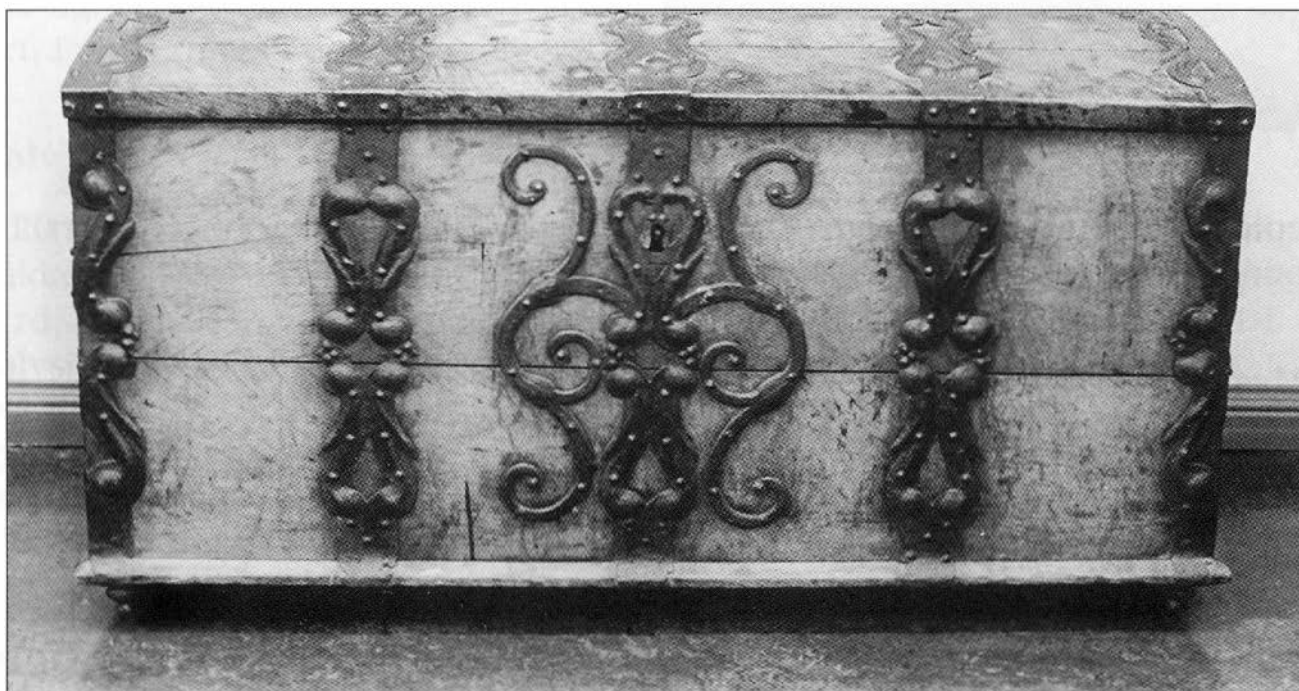
Eikekiste fra 1600-tallet, MHB 764, fra Risøy. Oppr. Hardanger.

1 eike-dragkiste med messing og jernhengsler 6 rd, 1 hengeskap med glassdør 2 rd, 1 seng med dreide stolper og blått og hvitt lerretsomheng 3 rd 2 ort, 1 seng med slette stolper og grønt Turkisomheng 2 rd, 6 Rysslær-