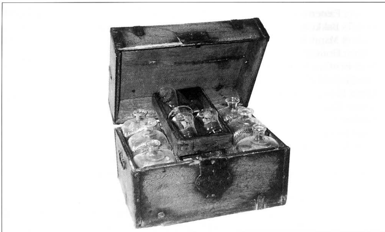
Flaskefor. MHB 4076.

arvingene «in natura» som forskudd på arven. Dette var skifteretten enig i, og besluttet straks å foreta utdeling.