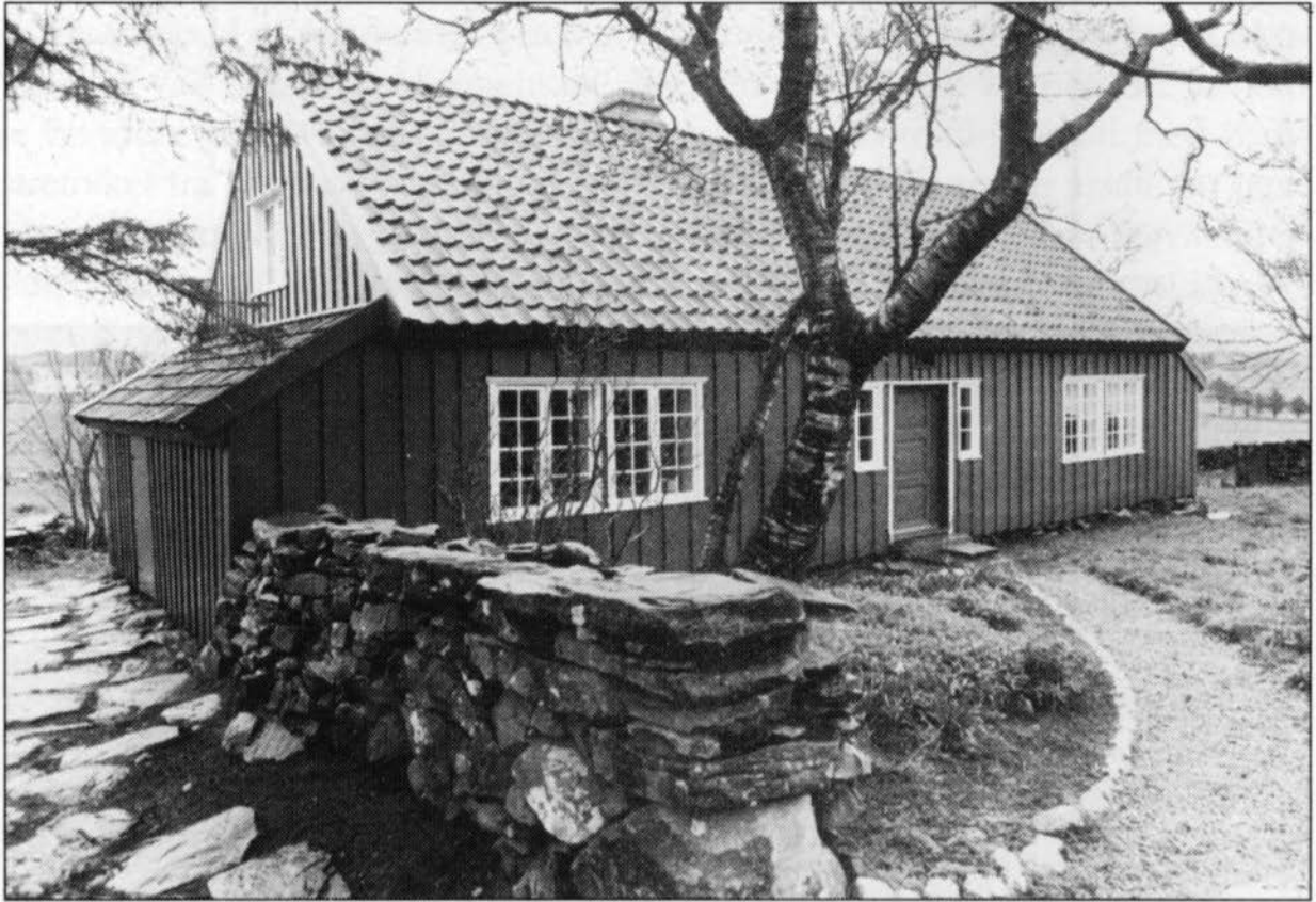
Det restaurerte Derikhuset på Salane, Hillesland i Skudenes.