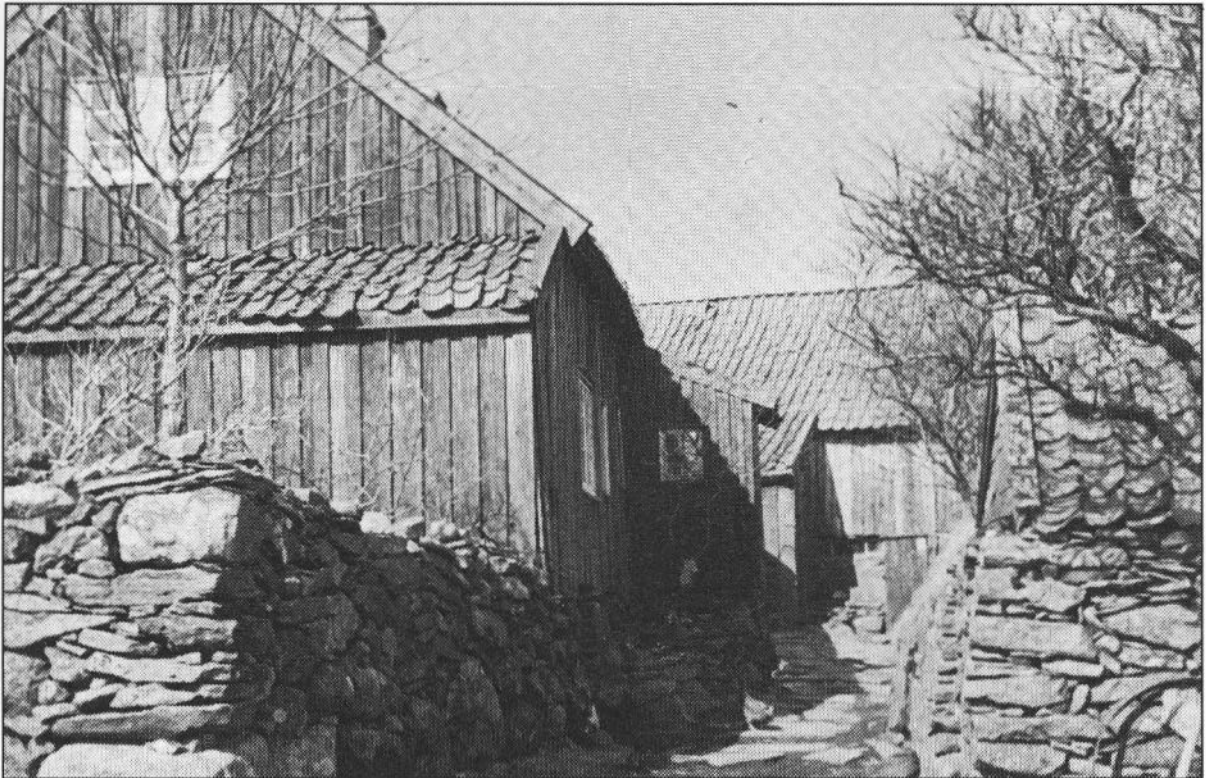
Miljø frå tunet på Salane, ca. 1951

Men som me veit så er det slutt på adelen her i landet - og det har gått tilbake med Losnaætta og.