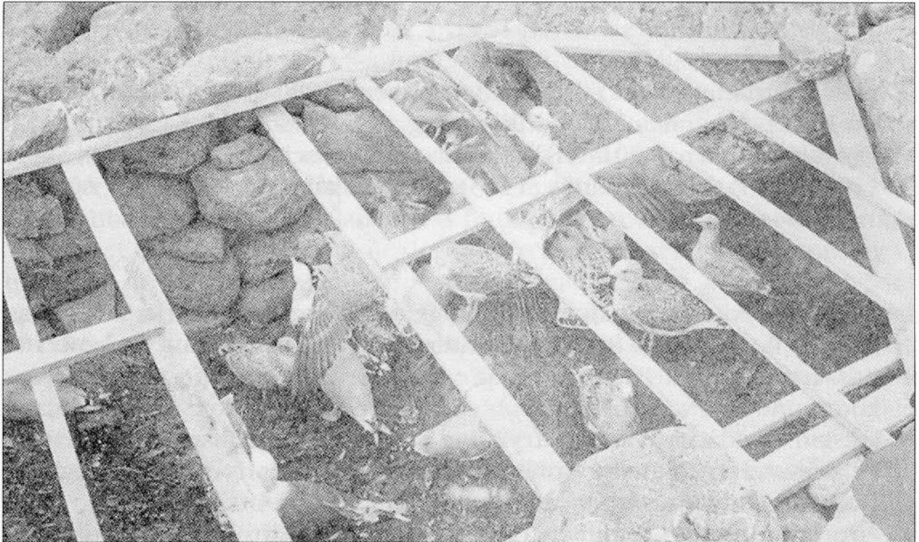
Frå kulturminnedagen 28. september 1997 hvor 24 måker ble fanget i måkehuset.