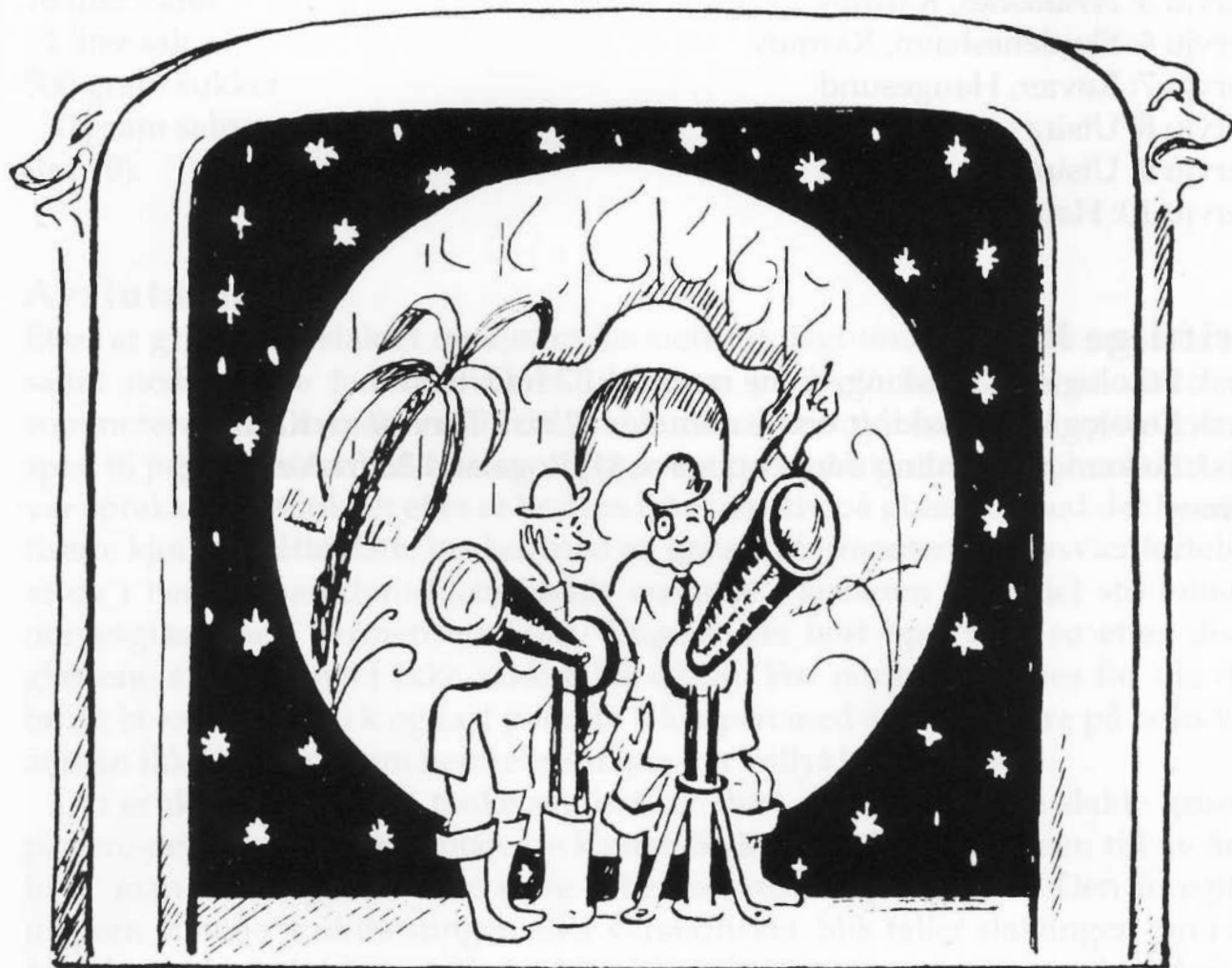
Forsiden til programheftet til "Vår lille aprilspøk", 1951. Ill. Erik Mæland.