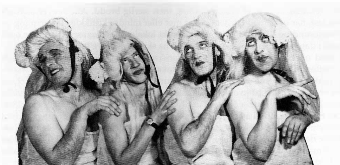
"Herrebaletten" fra "Smil over byen".