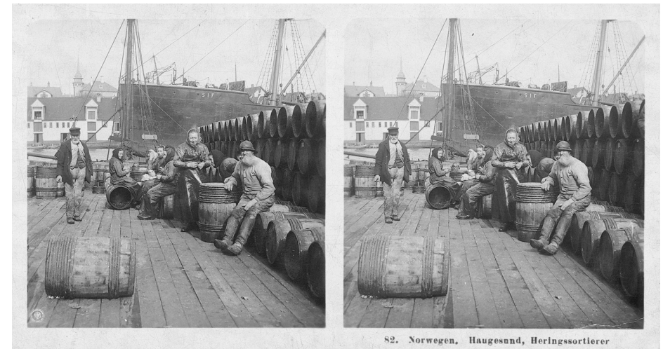
82. Norwegen, Haugesund, Herings-sortierer