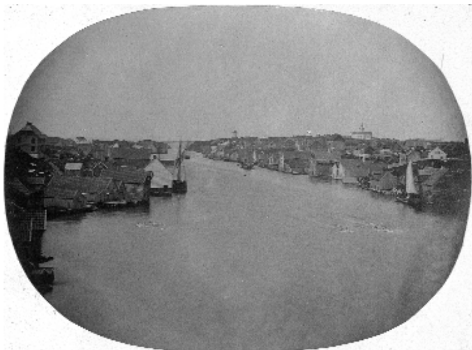
Det eldste, kjende fotografiet av Haugesund frå tidleg i 1860-åra viser Smedasundet med hamna på bysida til høgre og Hasseløy til venstre. Fotografen stod på Trosnaberg på Risøy. I bakgrunnen til høgre ligg gamle Skåre kirke. Heile området høyrde til Skåre sokn i Torvastad prestegjeld. Kyrkja vart rivne 1878 og erstatta av noverande Skåre kirke i Haugesund prestegjeld.

Foto: Jan Greve (?), kopi Margit Petersen, Karmsund folkemuseum MHB-F.7441