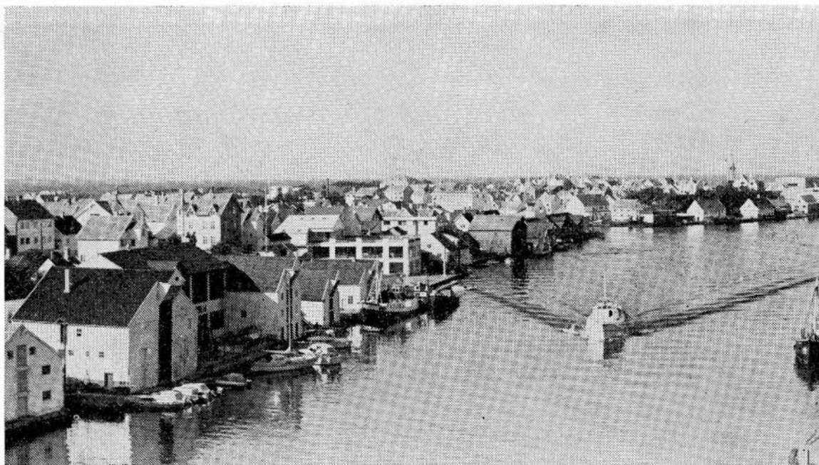
Risøy, fotografert mot nord fra Risøybrua. I bakgrunnen Hasseløy. Byen har ingen avskjerming mot havet i denne retningen.

dommer. 5 gater krysser Sundgt. på dette stykket slik at den deles i 4 like store deler. Videre omfattet registreringen en kvartalrekke tvers over øyen, nemlig rekken mellom Vågsomt. og Fresvigsomt. like fram til Hallelandsomt. Dette feltet omfattet 26 eiendommer. Endelig omfattet registreringen 4 eiendommer i husklyngen på nordvestre del av øyen — «Vest på Risøynå». Tilsammen ble 78 eiendommer gjennomgått, d.v.s. ca. halvparten av boligeiendommene på denne delen av Risøy. Ved å avgrense registreringsområdet som nettopp skissert, fikk man med både det selv-grodde og det regulerte boligmiljøet, gateenheten og kvartalenheten, og alle typer hus fra de minste til de største, fra de eldste til de yngste.