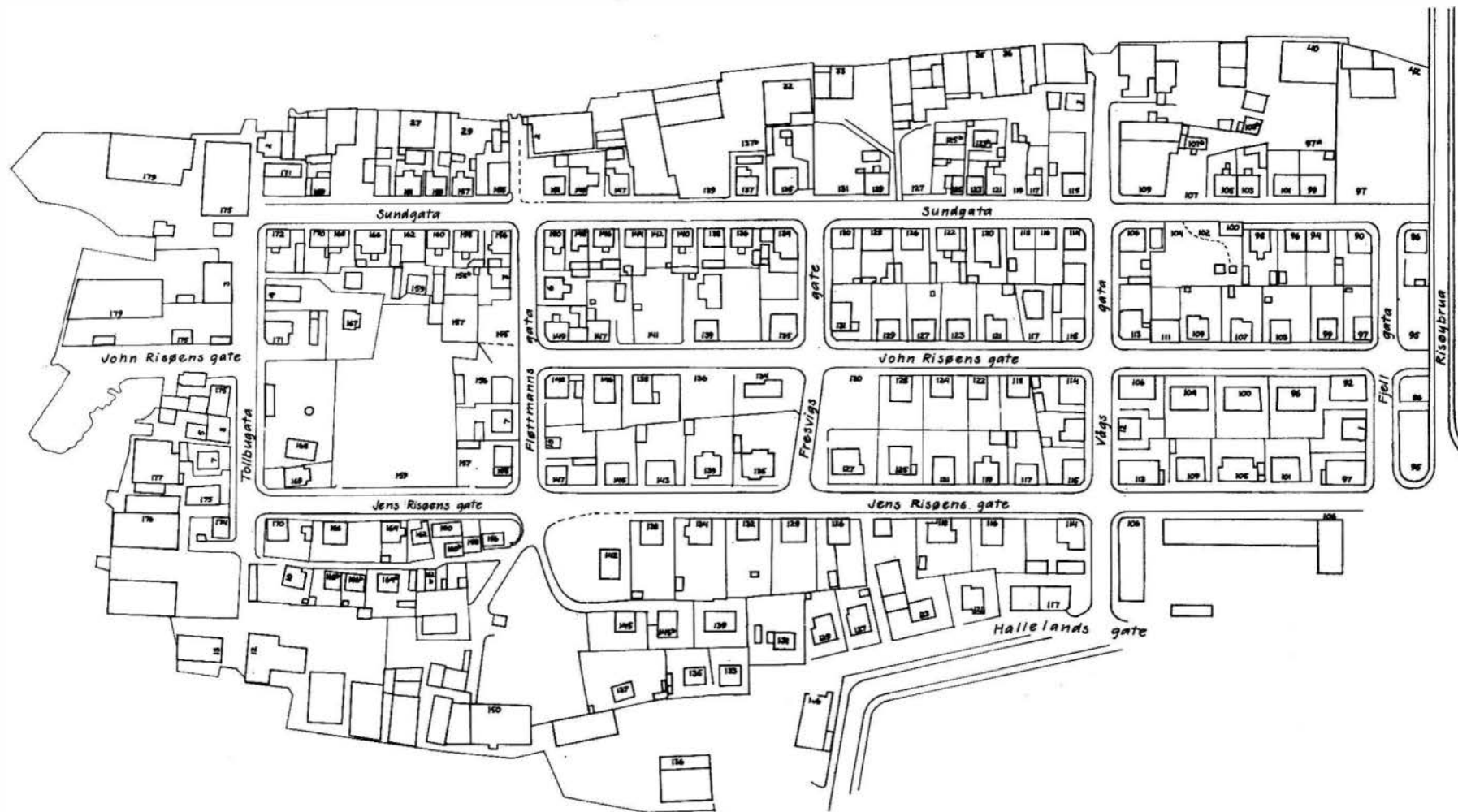
Undersøelsesområdet på nord-Risø. Sjøbusbebyggelsen mot vest var revet på registreringstidspunktet.