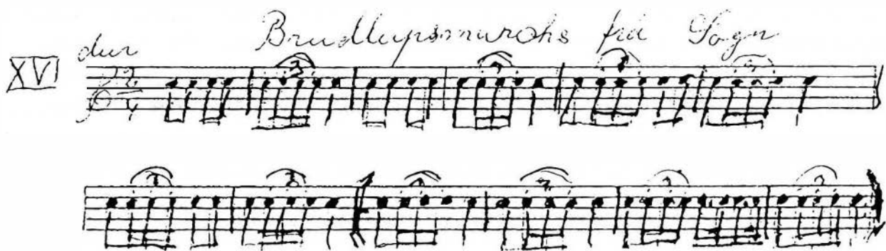
Nr. XVI: Brudlupsmarschs frå Sogn

De neste 12 er slåtter i 2- og 3-delt takt, hvor flere er notert i moll, som nevnt at slagfiguren spilles med høyre trommestikke. Her finnes bl.a. slåtten Sjuspringen. Denne ble regnet som en spesielt vanskelig slått. Navnet kommer av at første reprise spilles én gang, den andre to osv. helt opp til