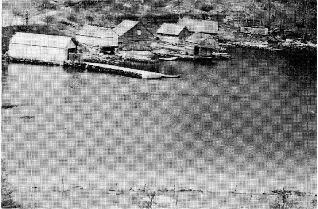
Dei gamle Sundfjørnausta. Nausta er sommaren 1965 oppmålte av arkitektstudentane Helge Raaen og Per K. Øvrebust ved NTH.

Regelen var at kvar parteigar heldt sine egne balkjer i stand med bøting og fornying. Men mykje av vedlikehaldet og stell av bruket kravde så stort mannskap at dei laut gå i hop om det, slikt som å barka nøtene, setja notbåtane på land etter fisket og på sjøen når bruket om våren skulle gjerast klart til fiske. Det var regel at dei tok 8 dagars tid når dei var ferdige med vårvinna til å stella med nøter og båtar så alt var i stand til dei venta det årvisse innsiget av makrell og sommarsild.