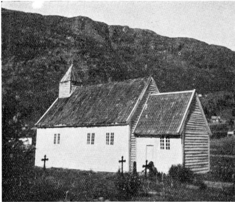
Røldal kyrkja fyre umvølingi