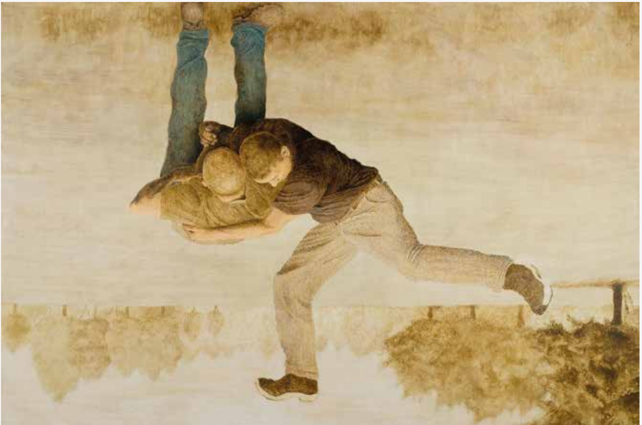
"Item 32", eggtempera på lerrett, limt på plate, 90 x 134,5 cm.