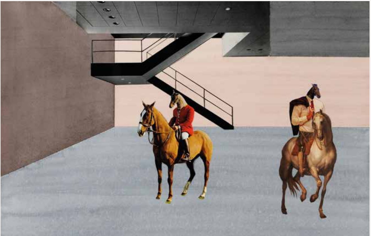
"Item 45", akvarell og collage på papir, 34,2 x 50,6 cm.

– Flaggstangen de amerikanske soldatene holder blir også forlenget i parasollstangen som holdes over Séguier?