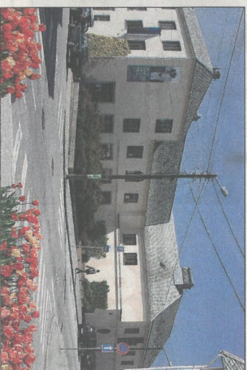
BYGNINGER: Karmsund Folkemuseum er en av 56 bygninger som Haugalandmuseet eier. I alt har museet ca. 20 årsverk og ingen er permittert.

omorganiseringen av det som tidligere het Haugalandmuseene. Behovet er absolutt stort og ser at det er mange oppgaver. Behovet er absolutt stort