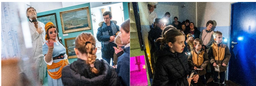
Figur 1 Familiearrangementet "Natt på museet" ble en stor suksess! Ansatte og frivillige i Haugalandmuseets venner i sving på Karmsund folkemuseum og i Wrangellhuset.