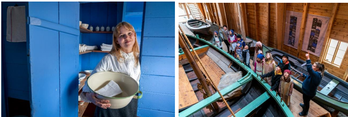
Figur 3 Haugalandmuseet vidareutviklar avdelingane med tanke på kulturturisme og reiseliv. I 2023 inviterte museumsverten «Anna» til basar i bedehuset i Dokken museum.