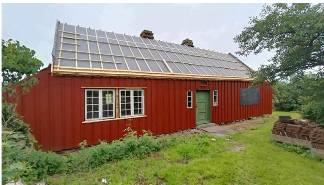
Figur 4 Derikhuset utafor Skudeneshavn vart årets store prosjekt i forvaltnings- og driftsavdelinga. Ei sårt tiltrengt restaurering starta opp i 2022 og pågår framleis. I 2023 vart huset måla med tranmaling og i juni vart det halde tranmalingskurs for interesserte fagfolk.

Malersvenneriet A/S. Tranmaling har i hundrevis av år blitt brukt langs norskekysten til utvendig maling av husveggar. Malinga vart produsert lokalt, ofte av huseigaren sjølv. Denne typen maling består av to hovudingrediensar: Fiskeolje og pigment. Tran vart blanda med pigment (vanlegvis raudt jordpigment) og påført veggane. Fargepigment var handelsvare, men ein kunne òg bruke lokale jordpigment. Ein periode var det fabrikkar som produserte maling med tran frå fiskeri langs kysten. Tranmaling lagast av råtran, fløyttran eller av varmebehandla tran. På dag ein lærte deltakarane å blande maling og pigment. På dag to vart heile våningshuset malt med tranmaling. Museet hadde tre deltakarar på kurset – ein konservator og to handverkarar.