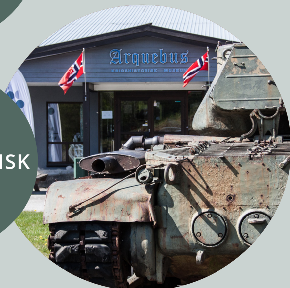
ARQUEBUS KRIGSHISTORISK MUSEUM