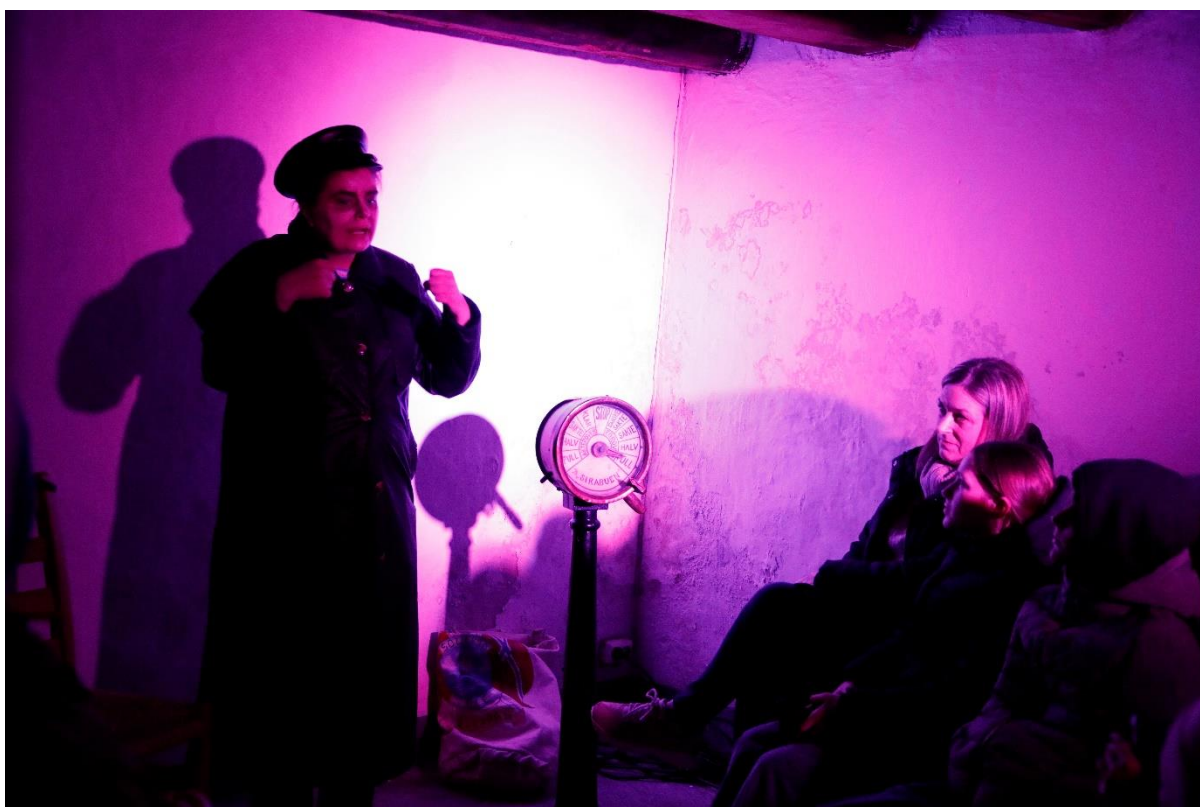
Årets «Natt på museet» vart utselt og ein stor suksess med mange lovord frå publikum

«Natt på museet» var det store arrangementet i 2024. Det var ein stor suksess med over 300 selde billetter, og stort engasjement frå frivillige og tilsette i møte med det yngre publikummet og deira familiar.