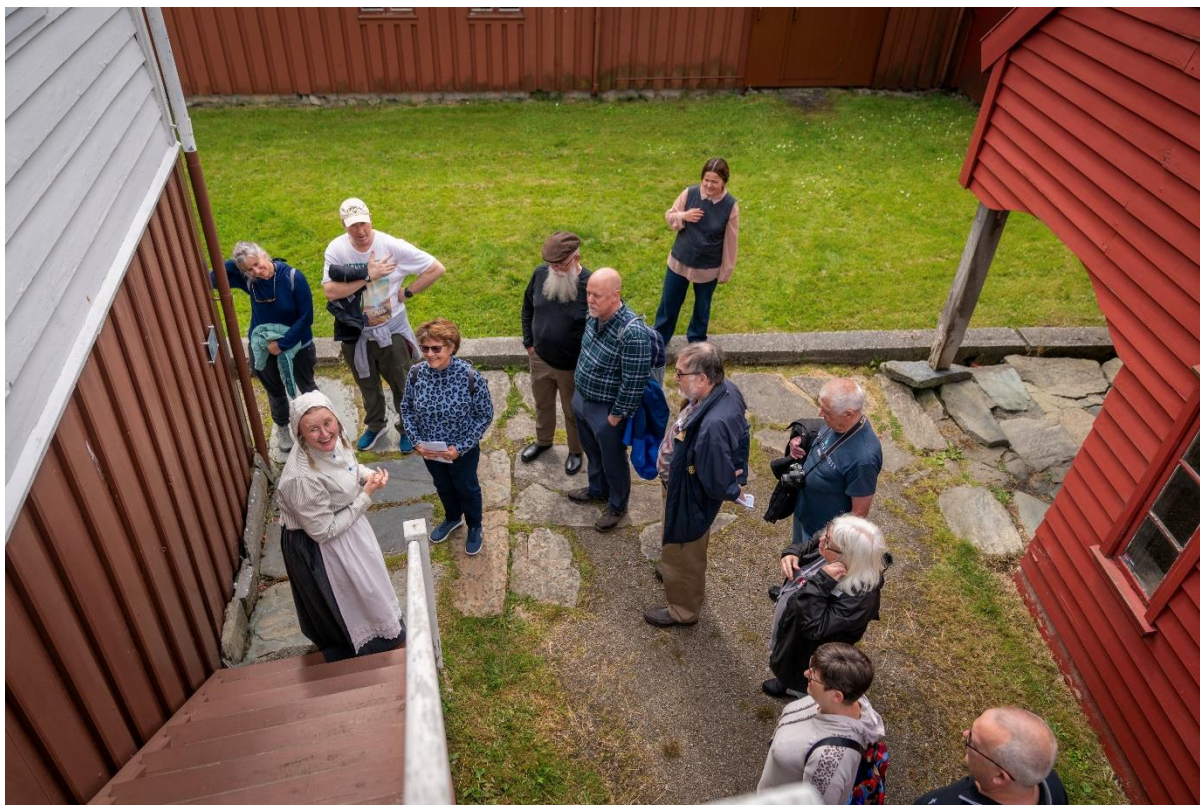
Sommaren 2024 var vi klare med historiske vertar i Dokken, takka vere utviklingsmidlar frå Kulturdirektoratet.

Det vart i mars søkt Kulturrådet om midlar til vidareutvikling (år 2) av det skissert treårige kulturturisme-prosjektet, med tema krig og fred, knytt til Arquebus krigshistoriske museum. Søknaden vart dessverre avslått. Museet har ambisjonar om å utvikle kulturturismen vidare, og ser på moglegheter for aktuelle prosjekt og finansiering for gjennomføring.