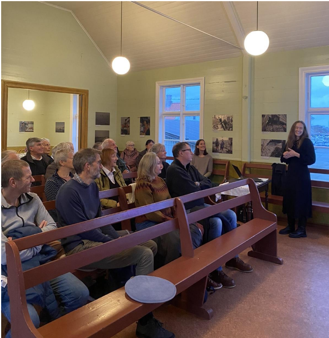
Foredrag og opning av fotoutstillinga "Kystfiskerne" i bedehuset, Dokken museum

Haugalandmuseet har som mål i strategiplanen å møte publikum med eit breitt og variert formidlingstilbod gjennom heile året. Museet sitt bygningsvernarbeid og samlingsforvaltninga er òg ein del av museet si formidling. Haugalandmuseet har mange utstillingar, både faste og midlertidige. Mange av utstillingane er i tråd med museet sitt strategiarbeid, der «havet» i perioden 2020-2025 belysast frå ulike kunst- og kulturhistoriske ståstader. I 2024 opna museet fire fotoutstillingar der havet spelte ei rolle.