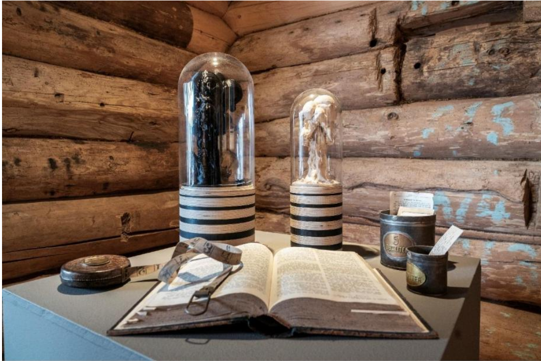
Figur 4 Frå Kunstnarblikk-utstillinga av Njål Lunde, i Tollbua på Nedstrand.