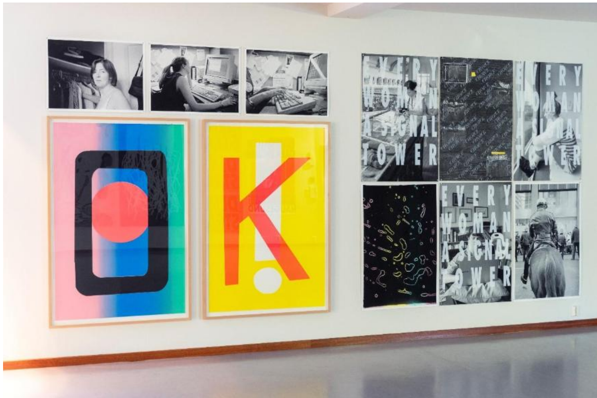
Figur 5 Haugalandmuseet fekk fleire kunstverk signert Ciara Phillips i gåve frå Otto Johannessenfondet i 2025.

Samlinga har ei hovudvekt på arbeid av kunstnarar eller verk med tilknytning til Vestlandet. Vi utviklar kunstsamlinga i tråd med museet sin innsamlingsplan 2020-2025. Museet har òg nasjonal og internasjonal høgtrykkskunst som eit tyngdepunkt i samlinga. I 2025 vart 63 kunstverk innlemma i samlinga. Tilveksten er i tråd med innsamlingsplanen til kunstmuseet. Dei aller fleste arbeida er av mannlege kunstnarar (38 mannlege og 8 kvinnelege kunstnarar). Alle kunstverka som vart innlemma i 2025 er gåver frå private og stiftingar.