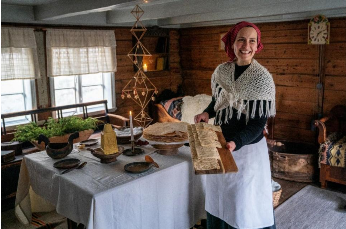
Figur 2 Tilsette og frivillige deltek i formidlinga under Jul i Dokken.