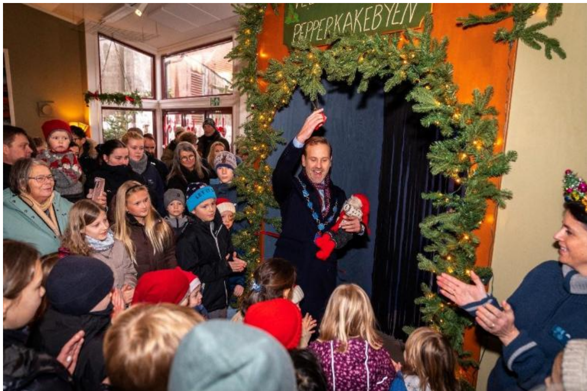
Figur 1 Ein engasjert ordførar opnar og ynskjer velkomen til Jul i Dokken, søndag 30. november 2025.

Haugalandmuseet har nettside, Facebook, Instagram og YouTube-konto, kor ein jamleg legg ut oppdateringar, foto, artiklar og filmsnuttar frå arrangement og museumsarbeid. Museet publiserer månadlege nyheitsbrev til veneforeininga og andre museumsinteresserte, med aktuelt stoff frå museet sitt arbeid. I alt 412 abonnentar mottar museet sitt nyheitsbrev.