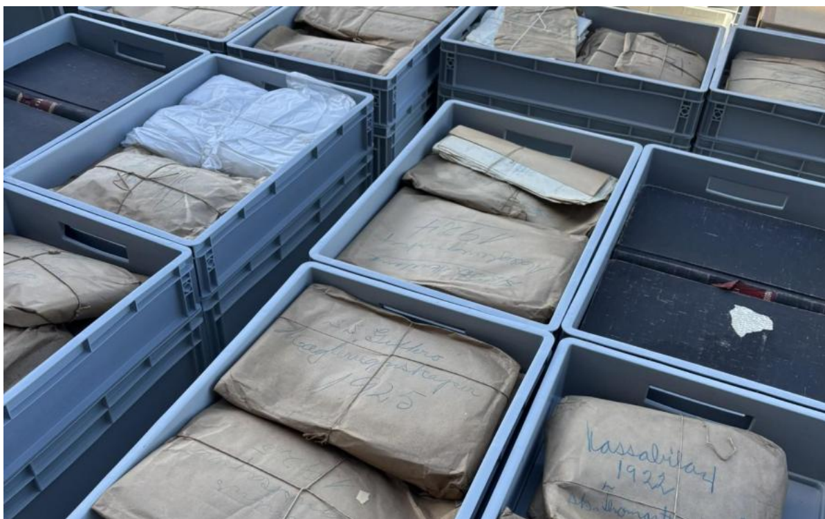
Figur 6 Takka vere støtte frå Arkivverket har ein jobba godt med reingjering og ordning av arkiv i 2025.

Auka dokumentasjon og digitalisering av samlingane gir større moglegheiter til god digital formidling. I Haugalandmuseet sin strategi er det eit overordna mål å få god bevaring, auka oversikt og innsikt, og tilgjengelegheit til viktige samlingar. Vi har arbeidd målretta med utgangspunkt i dei ressursane vi har. Ordning av arkiv har vore eit prioritert område. Takka vere midlar frå Arkivverket er vi godt i gang med eit tre-årig prosjekt, der vi har reingjort og ordna heile arkivet etter sildeeksportør Oluf Olsen, eit unikt forretningsarkiv i norsk samanheng.